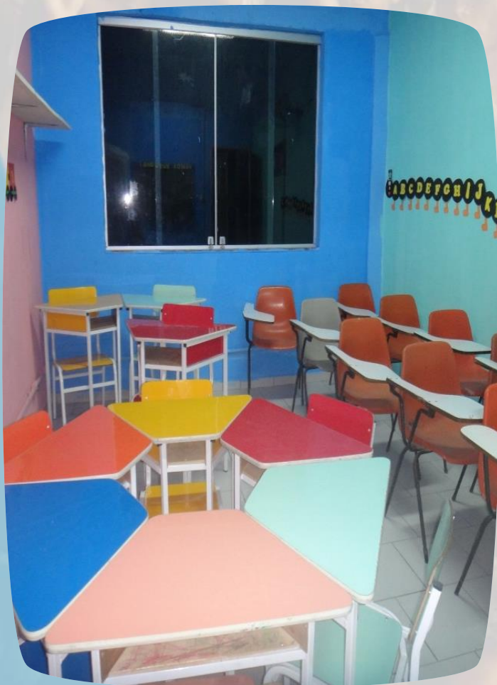
Sala de Aulas limpas, pintadas e organizadas.