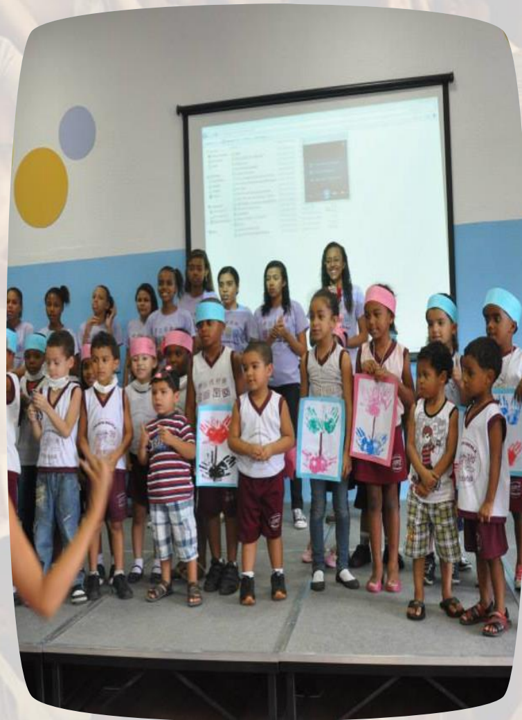
Apresentação em comemoração a semana do meio ambiente