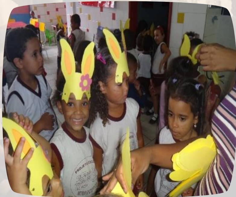
Festa da Páscoa