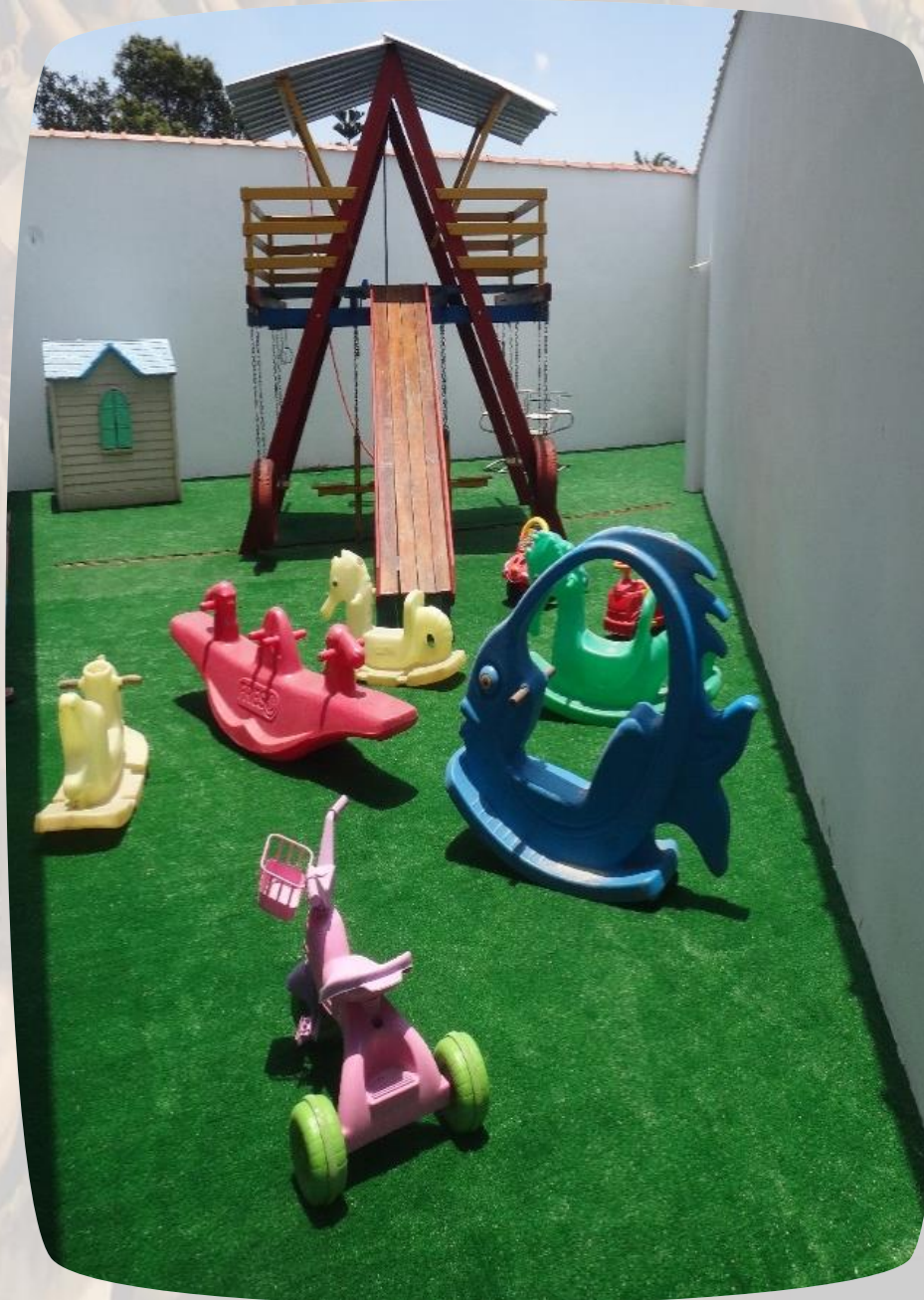
Parquinho reformado e organizado para volta às aulas