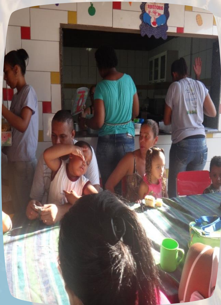
Café da manhã, servido aos pais e as crianças no primeiro dia de aula!