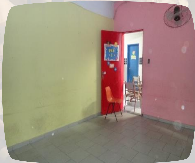
Pintura das salas de aula