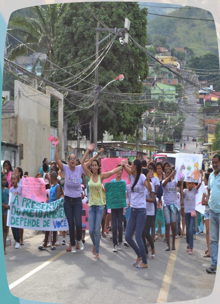
Caminhada do Meio Ambiente