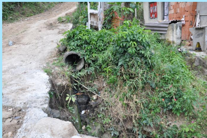
Foto do Morro da Chatuba tirada pelos nossos monitores

Refletir no que eu poderei fazer para melhorar aquilo que não vai bem a minha volta.